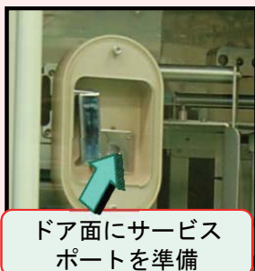
ドア面にサービス ポートを準備