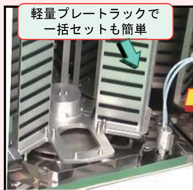
軽量プレートラックで 一括セットも簡単