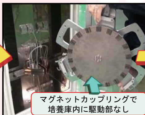
マグネットカップリングで 培養庫内に駆動部なし