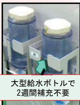
大型給水ボトルで 2週間補充不要