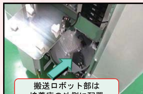
搬送ロボット部は 培養庫の外側に配置