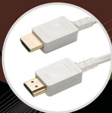
HDMI 2.0 (Plenum) A to A