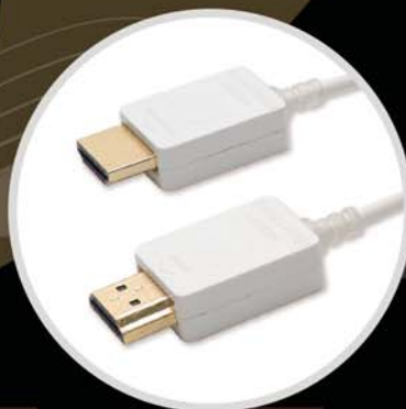
HDMI 2.0 (Mobile) A to A