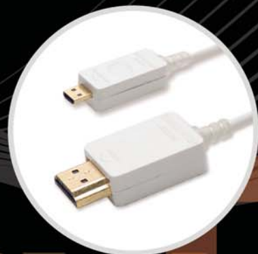
HDMI 2.0 (Mobile) D to A